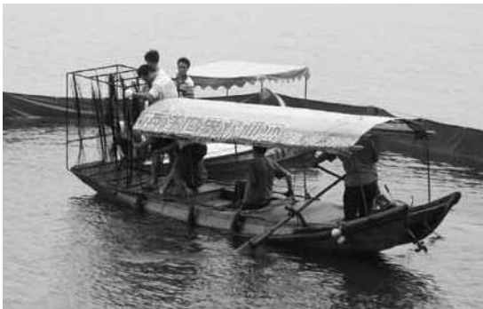
▲中国湖北省武漢市東湖での設置作業。中国では「日本水生協協会」として活動。